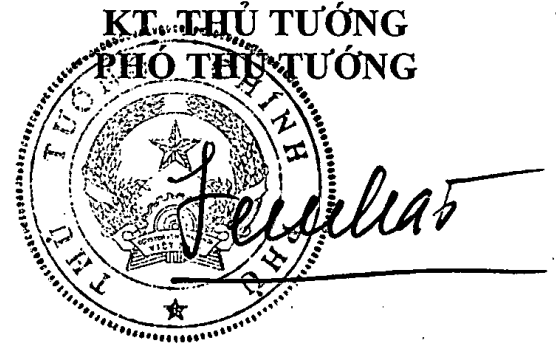
Lê Minh Khái